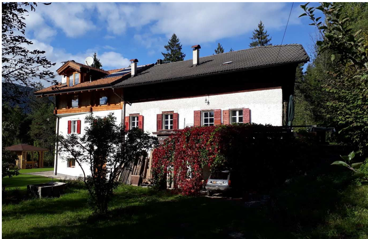
Vista da sud