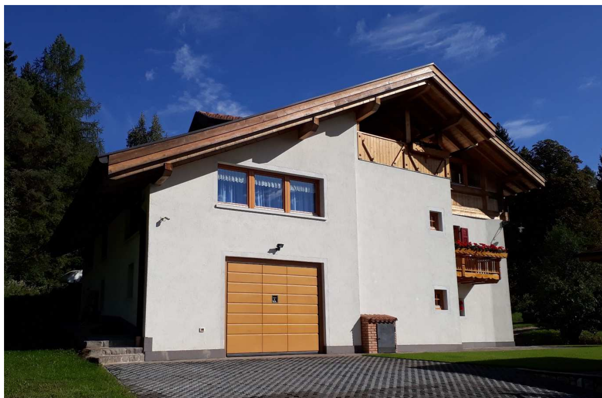
Vista da nord